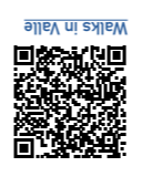
Makes in Valle

Between Skara and Billingen the inland ice has left behind a fauna. If you want to go hiking, there are 60 km of marked trails to explore. Most of the trails are marked with orange signs in the certain, while some of them have their own symbols (see symbols on the map). The right of public access gives us the opportunity to hike freely in the nature, but also gives us the responsibility to never leave anything but footprints behind. Always close gates behind you and keep your dog on a leash while enjoying the beautiful nature in Valle. Regulations for each nature reserves is found on information signs by the reserves or at lanssyrcles.n.se