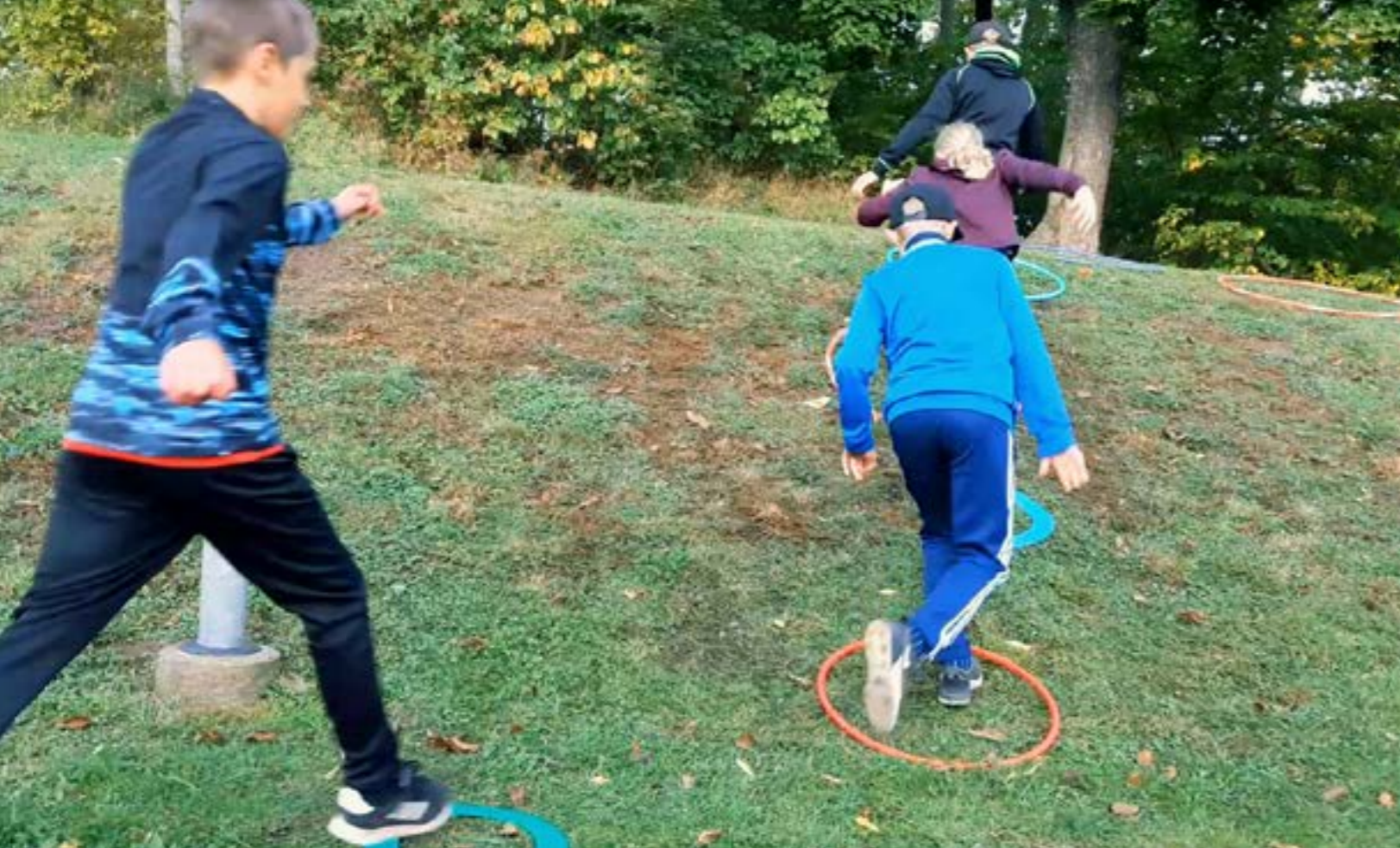
Att arbeta hälsofrämjande är mycket viktigt för att stärka folkhälsan och förebygga ohälsa både på lång och kort sikt. Rörelse och fysisk aktivitet har en positiv inverkan på både det psykiska välbefinnandet och den fysiska hälsan. Skolorna i Skara kommun arbetar med fysisk aktivitet och hälsofrämjande åtgärder. Bild från årskurs 6 i Valleskolan i Varnhem.