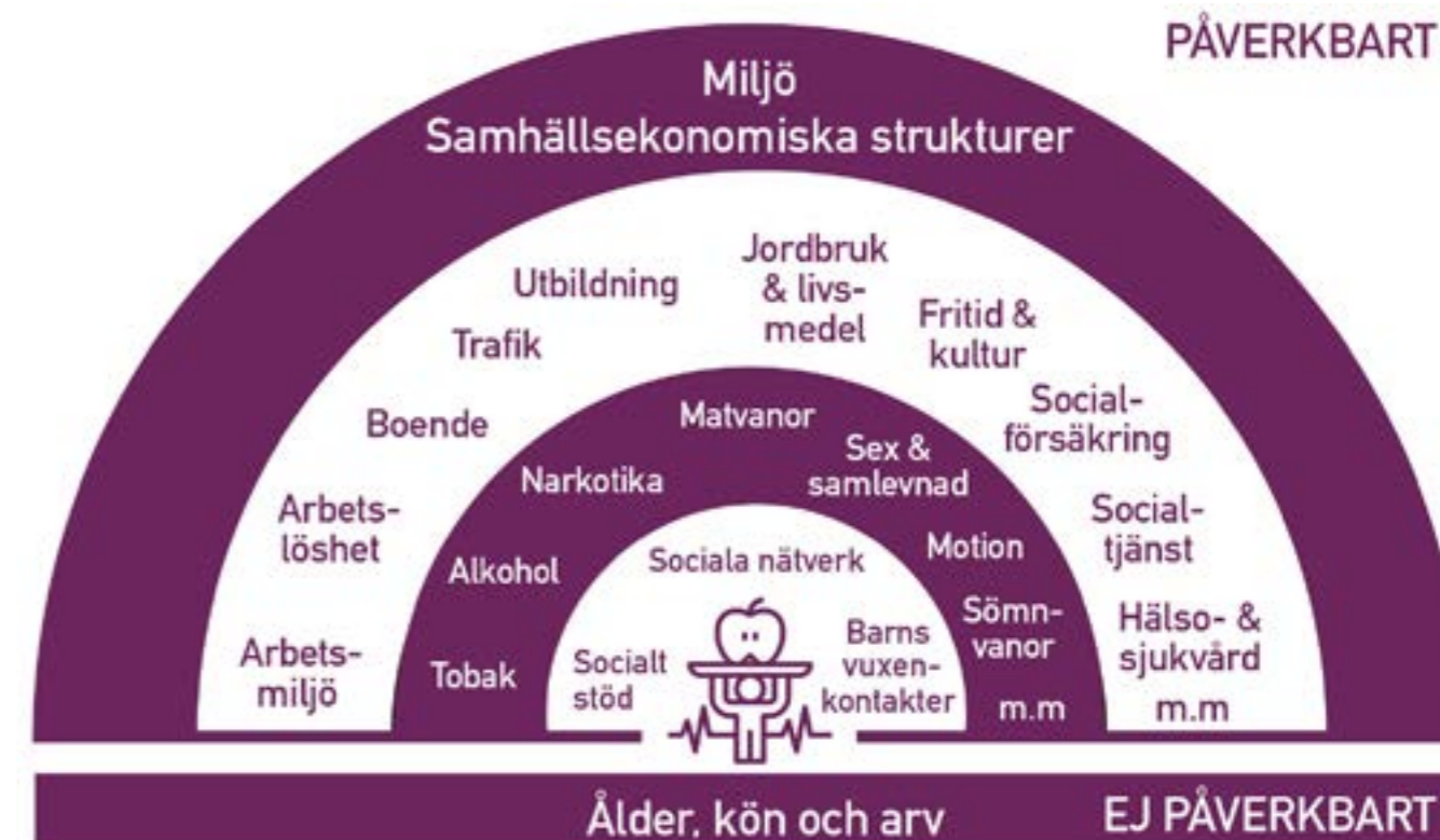
Fotnot: Vidareutveckling av struktur utformad av Leif Svanström och Bo Haglund

Sjukpenningtalet bland kvinnor i Skara är högt. Den största orsaken till sjukskrivningar hos kvinnor är psykisk ohälsa. Detta behöver analyseras och jämställdhetsarbetet stärkas. Många unga flickor har idag en psykisk ohälsa. För att de ska klara yrkeslivet behövs tidiga insatser som stärker deras hälsa både psykiskt och fysiskt. För att få ett fungerande folkhälsoarbete krävs samverkan och en helhetssyn på människan. För att barn och unga ska få goda förutsättningar i livet behöver de en välfungerande skola, möjligheter att påverka sin vardag och samhällsutvecklingen, goda förutsättningar till en meningsfull fritid, extra stöd vid behov och föräldrar som tar hand om dem. För att nå detta måste vi dra åt samma håll.