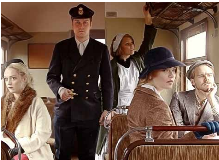
13 OKTOBER: Slutstationen – en mordgåta i tågmiljö.