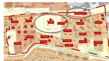
Inringat på kartan: Gälakvist och stationsområdet med godsmagasinet

I stadsdelen ingår också en mindre del av järnvägsområdet där godsmagasinet ligger, mellan stationen och lokstallet. Godsmagasinet användes för lossning och lastning av gods vid järnvägen. Byggnaden används inte längre för järnvägsändamål utan hyser sedan slutet av 1980-talet ett musikproduktionsföretag. För förståelsen av järnvägens historia i Skara är det dock en viktig pusselbit i den miljö som är bevarad.