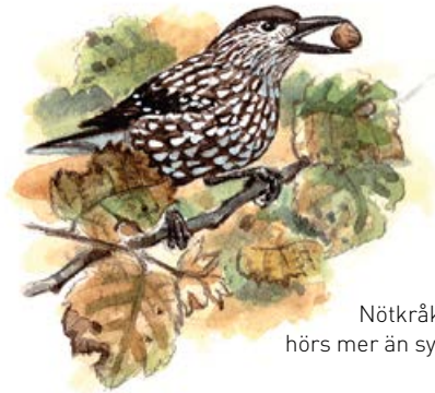
Nötkråkan hörs mer än syns.

Just till vänster efter att stigen delar sig uppe i sluttningen ligger en liten stenhög som en gång var backstugan Lunnaliden , där Bagga-Lars bodde med en sinnessjuk dotter i slutet av 1800-talet.