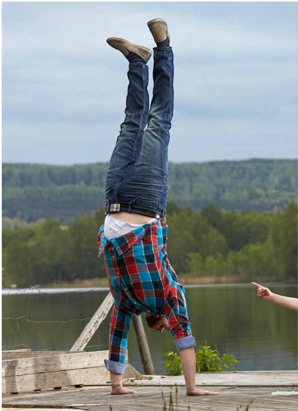
I Vackra Valle kan det vara svårt att hålla

FRAMSIDA: Bada i Valle.