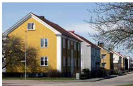
Stadsdelen S:t Anne äng är först ut