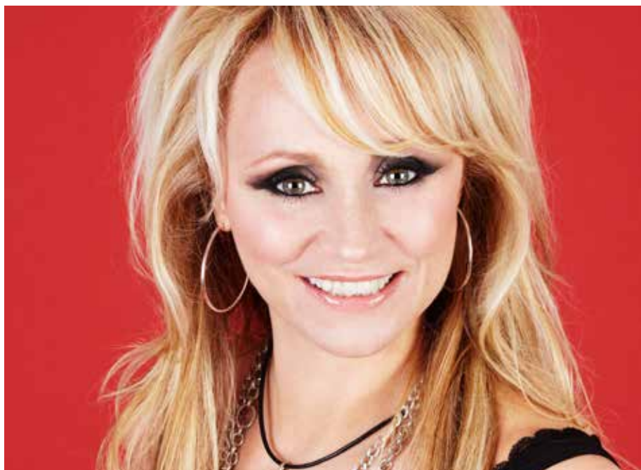
NANNE GRÖNVALL KOMMER TILL SOMMARKVÄLLAR I SKARA 15 AUGUSTI