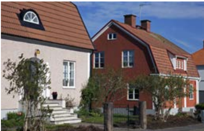
Vasagatan 13 och 15 från 1924 och 1925, med 20-talsklassicistiska detaljer i putsfasaderna, som pilastrar och markerad entré, mansardtak och lunettfönster.