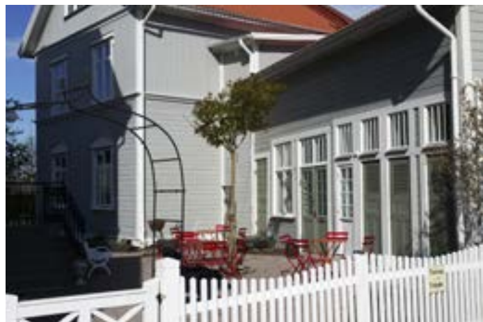
Gårdshuset på Vasagatan 1 har en egen och enklare stil än huvudbyggnaden.

I dagens Brinkagärdet är det framförallt de varierade uttrycken i bebyggelsen som är slående och den ofta påkostade och anslående arkitekturen i olika stilar och ideal från 1870-tal till 1930- men även 1950- och 1960-tal. Skalan är däremot väldigt homogen, med undantag för några flerbostadshus och det höga Lilla Seminariet. Stadsdelens närhet till Gamla staden gör också att karaktären i Brinkagärdet i ganska stor utsträckning präglar intrycket av Skara för besökare eller turister, med friliggande hus i lummiga uppvuxna trädgårdar.