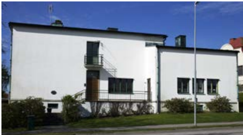
Malmgatan 21 är en av stadsdelens mest utpräglade funktionalistiska byggnader, och kanske den i Skara bäst bevarade och minst förändrade av de som finns. Den byggdes redan 1930. Notera kopparklädd skorsten och stuprör i koppar samt avsaknaden av fönsteromfattningar och andra fasaddekorationer.

I stadsdelen finns också några utpräglat funktionalistiska byggnader att nämna. Malmgatan 21 från 1930, Brinkagatan 14 från 1937 och Hindsbogatan 23 från 1937. Byggnaderna avviker markant från omgivningen med sitt raka och osmyckade uttryck. De har alla varit med om en del förändringar genom åren, men har i stort behållit sin ursprungliga karaktär. Det finns få så utpräglat funktionalistiska byggnader i Skara, så byggnaderna och dess ursprungliga uttryck bör värnas vid framtida förändringar. Brinkagatan 8 från 1936 är en intressant hybrid som med formelement från både funktionalismen och 1920-talisklassicismen visar på övergången.