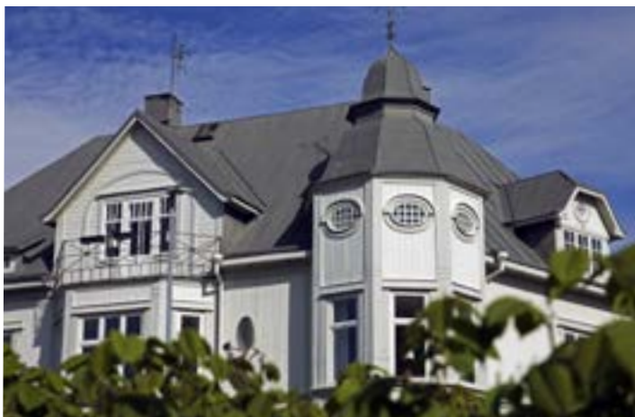
Vasagatan 1A, kallad Villa Fenix, är en av få byggnader i Skara med jugendinslag. De ovala fönstren på tornhuset och den rundade omfattningen kring balkongentrén är de kanske tydligaste jugenduttrycken i träfasaden.