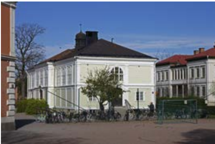
Nuvarande friskolan Metis gymnastiksal är en rikt dekorerad träbyggnad från tiden omkring sekelskiftet 1900. Till höger syns samtida Sturegatan 8A (Odensvik) som är en av stadsdelens stora bostadshus i trä.