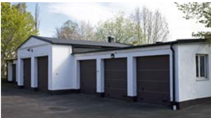
Innanför bostadshuset på Kinnekullegatan 28 finns det här originella garaget med åtta portar. Två av portarna markerar byggnadens mittpunkt på klassicistiskt manér och skulle kanske även kunna varit tänkt för någon typ av större fordon som buss eller lastbil. Notera det markerade gavelröstet på det utskjutande mittpartiet.

Innanför bostadshuset på Kinnekullegatan 28, på fastigheterna Boken 29 och 43, finns ett stort vitputsat garage. Det ser ut att ha använts för en mindre verksamhet med lastbilar eller bussar av 1930-talsmått. Tyvärr har vi inte lyckats få fram mer information om vad byggnaden har haft för funktion, men den utgör ett speciellt och intressant inslag i stadsdelen idag.