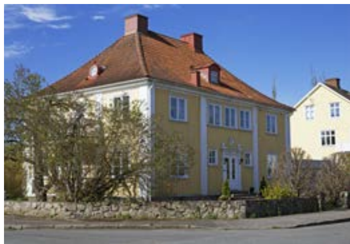
Vasagatan 9/Sturegatan 13 från 1922 är en av stadsdelens finaste 1920-talsklassicistiska byggnader. Notera det pagodliknande valmtaket, takfönstret i form av så kallat oxöga och klassicistiska snickeridetaljer vid entrén.

Behovet av bostäder var fortsatt stort i den allt ökande urbaniseringen och industrialiseringen. Enstaka hus byggdes i en något moderniserad men likartad stil under 1940- och 1950-talet, där Kinnekullegatan 34 är ett exempel (se nästa sida). Inne i kvarteret, på Engelbrektsgatan, tillkom också tre mer tidstypiska bostadshus på 1960-talet. År 1974 byggdes Kinnekullegatan 32 som i form och volym anknyter till 1930-talshusen, men för övrigt speglar mycket av 1970-talets byggande i material och detaljer.