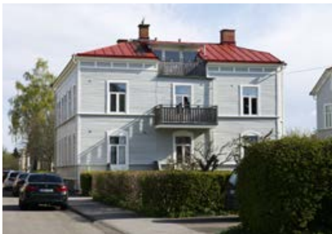
Vasagatan 6 tillhör de större träbyggnaderna i stadsdelen.