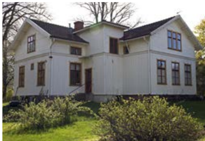
Malmgatan 17 tillhör den äldsta bebyggelsen i stadsdelen och är byggt redan 1875. Huset kallades Brunnsvik och ingår i den rumsligt något avskilda miljön vid Drysan med S:ta Annagatan 28 och 30.

har tomten kompletterats och nu är det tre hus, varav ett kan vara en hantverkslokal men möjligen också en bostad. På tomten direkt söder därom (S:ta Annagatan 17A-C) har en liknande utveckling skett, då ett hus har rivits och ersatts av tre nya bostadshus, alla idag bevarade. De trånga gårdarna och de många bostadshusen på dessa båda tomter är en god illustration av stadens expansion vid tiden. Hade man kommit över en bit mark gällde det att utnyttja den till bostadens gränser, för efterfrågan på bostäder var stor.