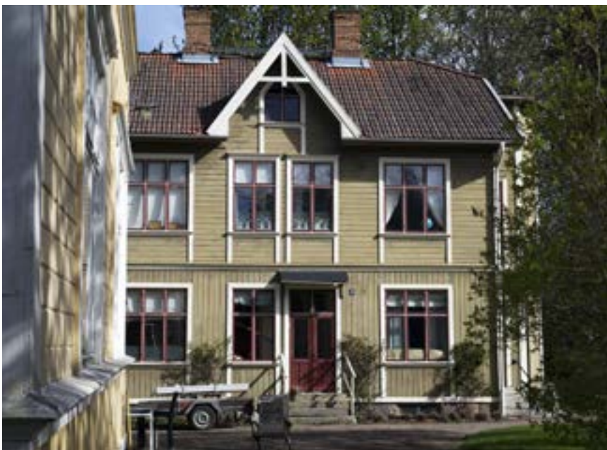
S:ta Annagatan 30 (med nr 28 i förgrunden) är en del av en egen rumsbildning i stadsdelen, där S:ta Annagatan slutar vid Drysan. Notera byggnadens något diskreta panelarkitektur, med stående träpanel på bottenvåningen och liggande på andra våning. Byggnaderna är uppförda 1912 respektive ca 1907.