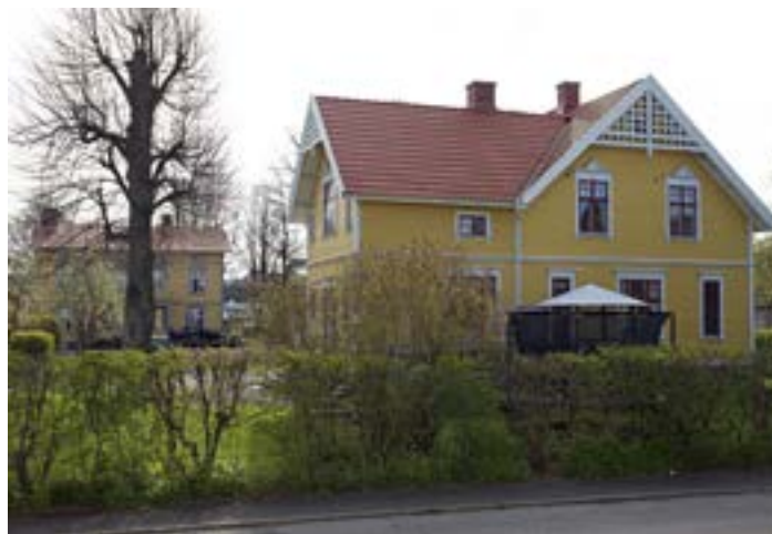
S:ta Annagatan 6 med särskilt dekorerat gavelröste. Gunnar Wennerbergsgatan 5 i fonden.