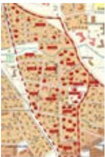
Stadsdelen Brinkagärdet ligger i norra delen av Skara. På sista uppslaget finns en karta i större storlek.