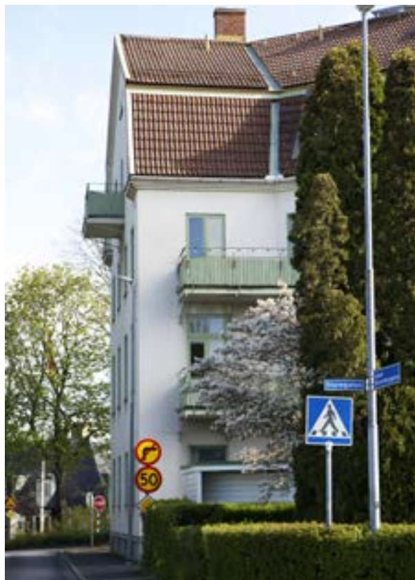
Kvarteret Albano, med en enda, men anslående, byggnad i fyra våningar från 1911. Notera de äldre balkongerna och uppdelningen av takets panntäckning. Nedan: Gårdshuset på Gunnar Wennerbergsgatan 7C är sannolikt byggt för mindre verkstadsarbeten och är ett varierande inslag utmed gatan.

Enligt den nya stadsplanen uppfördes flera större hyreshus i trä och tegel, vilket ger en stadsmässig prägel på de södra delarna av Brinkagärdet, vid Gunnar Wennerbergsgatan och S:ta Katarinagatan. Men i jämförelse med de samtida kvarteren direkt söder om järnvägen (se stadsdelshäftet om Kämpagården) har stadsdelen Brinkagärdet i första hand en villaförstadskarakter. Som exempel kan nämnas det i sig stadsmässiga och välbevarade S:ta Annagatan 14A, som omges av lägre och mindre bebyggelse.