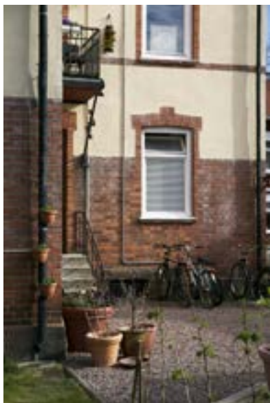
S:ta Annagatan 14A tillhör den mer stadsmässiga bebyggelsen i stadsdelen. Innergården ramar vackert in av den höga tegelsockeln.