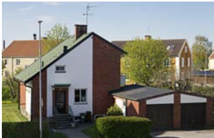
Hindsbogatan 31 från 1961 i säregen modernistisk stil sticker ut i stadsdelen. Notera det asymmetriska sadeltaket, de gröna takpannorna och de vita putsade fälten som bryter av tegelfasaden.

Innanför bostadshuset på Kinnekullegatan 28, på fastigheterna Boken 29 och 43, finns ett stort vitputsat garage. Det ser ut att ha använts för en mindre verksamhet med lastbilar eller bussar av 1930-talsmått. Tyvärr har vi inte lyckats få fram mer information om vad byggnaden har haft för funktion, men den utgör ett speciellt och intressant inslag i stadsdelen idag.