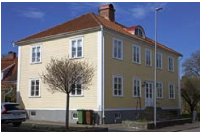
Tulegatan 11 tillhör gatans 1920-talsklassicistiska bebyggelse. Det valmade taket och lunettfönstret är karaktäristiskt för tiden.