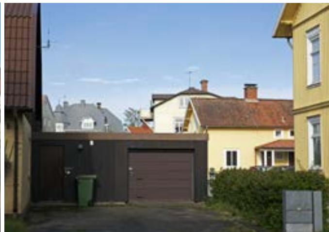
Brinkagärdet är en varierad stadsdel. Från S:ta Annagatan 11B från 1975 kan man blicka ut över byggnader med många olika uttryck och historia.

har tomten kompletterats och nu är det tre hus, varav ett kan vara en hantverkslokal men möjligen också en bostad. På tomten direkt söder därom (S:ta Annagatan 17A-C) har en liknande utveckling skett, då ett hus har rivits och ersatts av tre nya bostadshus, alla idag bevarade. De trånga gårdarna och de många bostadshusen på dessa båda tomter är en god illustration av stadens expansion vid tiden. Hade man kommit över en bit mark gällde det att utnyttja den till bostadens gränser, för efterfrågan på bostäder var stor.