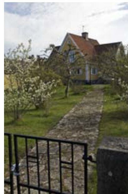
Vegetationen är ett viktigt inslag i hela stadsdelen Brinkagärdet. Till flera av bostadshusen får man vandra genom stora trädgårdar. Här är vi på väg in till Kinnekullegatan 14.

stående träpanelfasad. De runda fönstren och lunettfönstren är också karaktäristiska inslag. En välbevarad släkting finns på Vasagatan 9/Sturegatan 13, byggt 1922, med ett pagodliknande valmtak. Fin 1920-talsklassicism kan även ses längre söderut i stadsdelen, på S:ta Annagatan 8 från 1923.