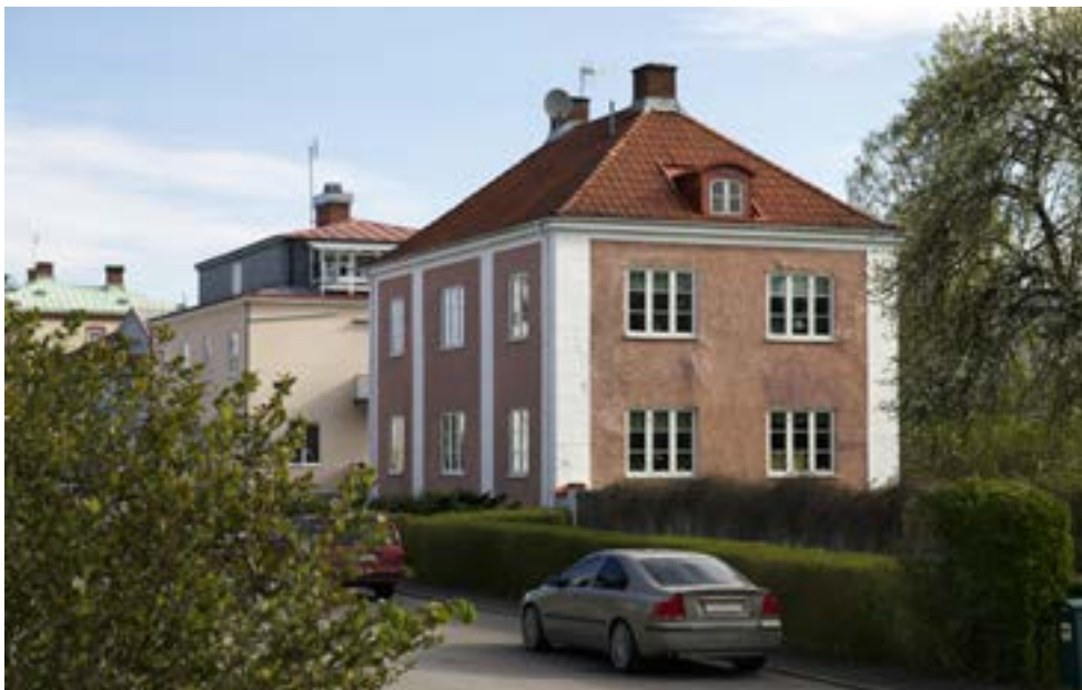
S:ta Annagatan 8 från 1923 är ett av stadsdelens finaste exempel på 1920-talsklassicism. Notera de tydligt markerade vita pilastrarna i både hörnen och på fasadens långsidor.