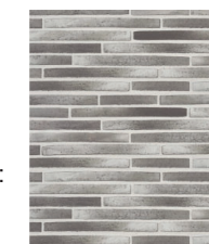
Tegel runt fönster mm: Randers Tegel Ultima RT 160 el likv.