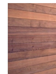
Indragna väggar vid balkonger: träpanel