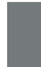
Aluminium-partier/fönster: Grå RAL 7037