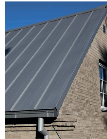
Takfotsfris i tegel

Takplåt, plåtavtäckningar och takavvattning: Aluzink