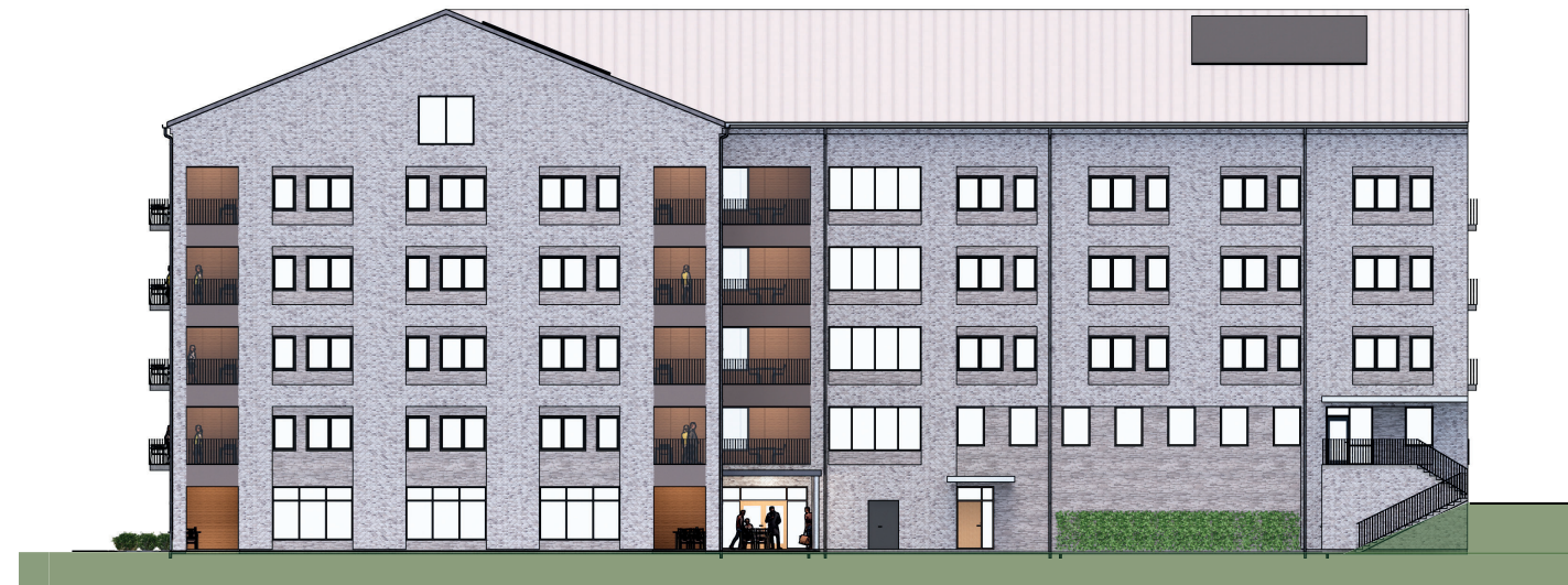
Fasad mot Väster