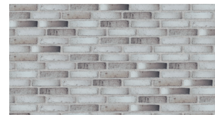
Randers Tegel: Attika RT 546 el likv.