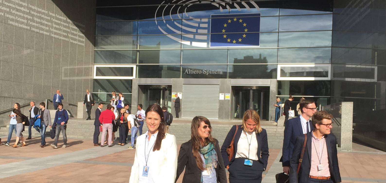
EU-parlamentet i Bryssel