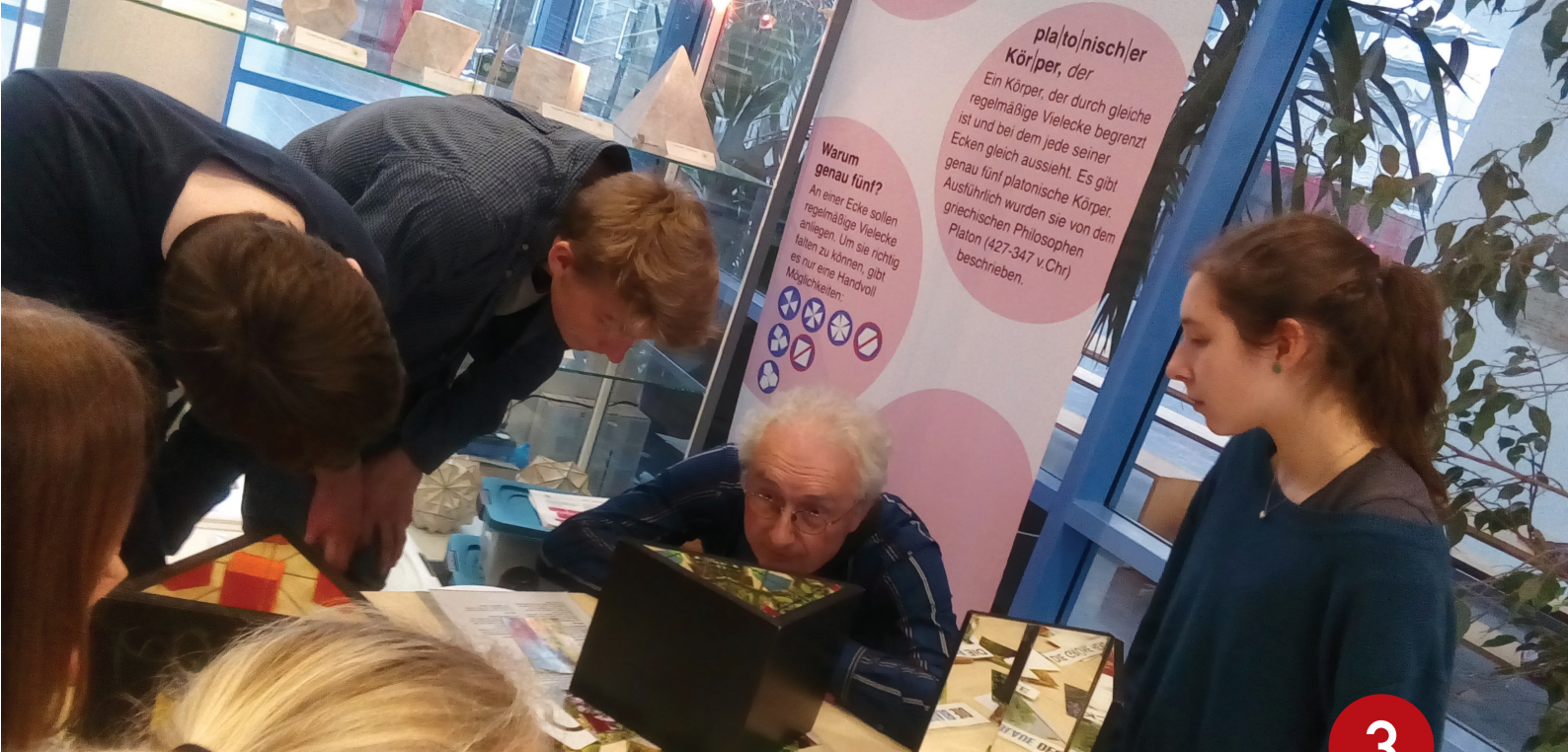
Erasmus+ -projekt mellan skolor i Belgien, Tyskland och Sverige. BEsök på Max Planck-institutet