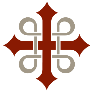
Leden är utmärkt med Sankt Olofskorset

5. Bissdrågen Medeltida gårdsnamn som anspelar på att biskopens följe