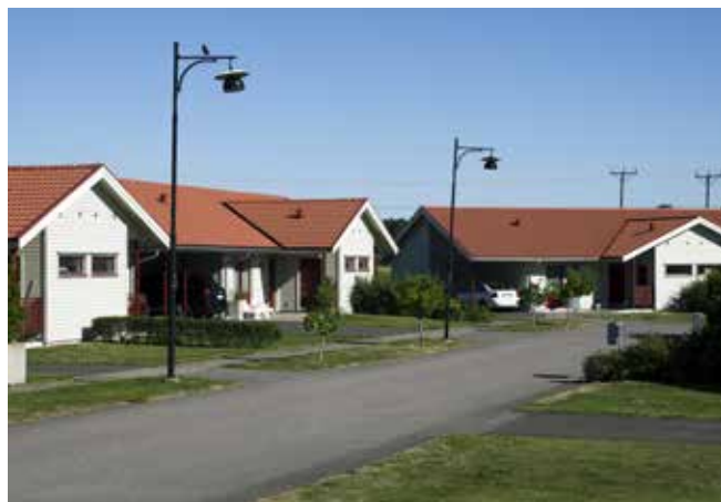
Till vänster: En anslående tegelfasad i kvarteret Prelaten. Notera de franska balkongerna med smidesräcken. Till höger: Domprostebyn från 2005 är modernismens motsats när det kommer till trafikplanering. Här får bilen åter ta plats intill bostadsentrén.

Väster om kvarteret Abboten, invid det gamla elverket och Fornbyn, uppfördes Domprostebyn 2005. Ett helt nytt kvarter, med undantag för den befintliga Domprostegatan 56 som integrerades tillsammans med den nya bebyggelsen. Domprostegatan 56 byggdes på 1930-talet som bostäder för personalen på det intilliggande elverket och användes senare som kontor för Skara Energi. Den nya bebyggelsen bär förstås även den på sin tids ideal och skiljer sig kanske mest från modernismens bebyggelse i stadsdelen, genom hur bilen åter fått ta plats intill husen och entréerna.