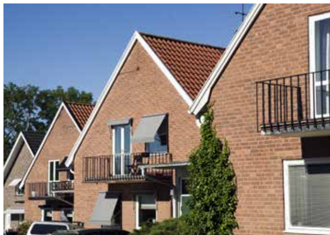
Ovan: Av de här tre kedjehusen i kvarteret Munken från 1951 är det bara huset längst i norr som fått behålla sina originalfönster. Huset längst i söder är byggt 1983 och avviker tydligt från de tre andra, även om avsikten uppenbart har varit att få huset att passa ihop med trion. Förutom att byggnaden har en annan typ av tegel är gavelsprången helt olika.

Väster om kvarteret Abboten, invid det gamla elverket och Fornbyn, uppfördes Domprostebyn 2005. Ett helt nytt kvarter, med undantag för den befintliga Domprostegatan 56 som integrerades tillsammans med den nya bebyggelsen. Domprostegatan 56 byggdes på 1930-talet som bostäder för personalen på det intilliggande elverket och användes senare som kontor för Skara Energi. Den nya bebyggelsen bär förstås även den på sin tids ideal och skiljer sig kanske mest från modernismens bebyggelse i stadsdelen, genom hur bilen åter fått ta plats intill husen och entréerna.